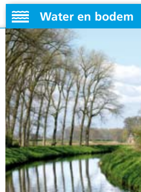
Water en bodem

Betrokken partijen: Waterschap Aa en Maas, gemeenten Bernheze en Sint-Michielsgestel, provincie Noord-Brabant.