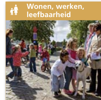
Wonen, werken, leefbaarheid