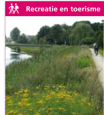
Recreatie en toerisme

Rol commissie: Begeleiden subsidie, kennis en advies. Betrokken partijen: Gemeente Oss, Woningbouwvereniging Mooiland Maasland, provincie Noord-Brabant.