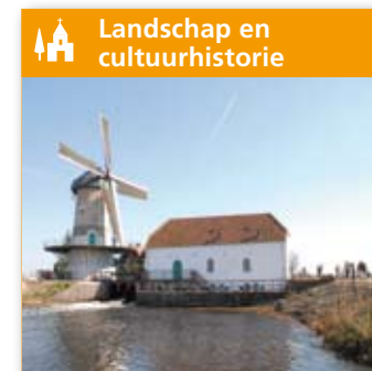
Landschap en cultuurhistorie

Rol commissie: Begeleiden subsidie, kennis en advies. Betrokken partijen: Gemeenten 's-Hertogenbosch, Sint-Michielsgestel, Vught, Heusden, Waterschap Aa en Maas, Waterschap De Dommel, Vereniging Natuurmonumenten, Staatsbosbeheer, Brabants Landschap, Brabantse Milieufederatie, Zuidelijke Land- en Tuinbouworganisatie (ZLTO) Hertogenboeren, provincie Noord-Brabant.