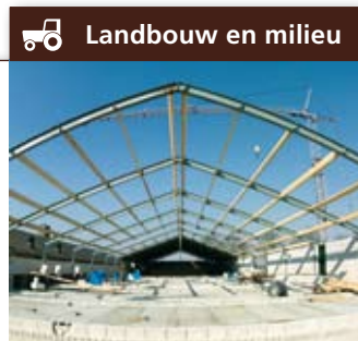
Landbouw en milieu

Rol commissie: Begeleiden van het proces en subsidies, kennis en advies. Betrokken partijen: Gemeente Bernheze, ZLTO, provincie Noord-Brabant.